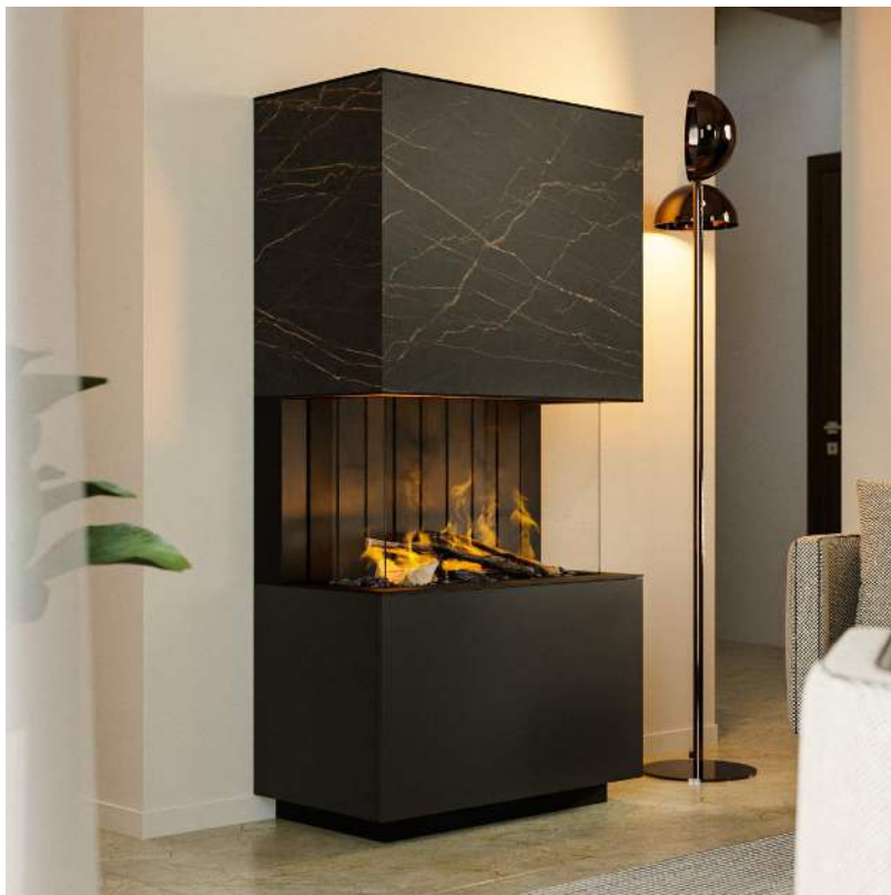
Panorama Drei Seiten Feuersicht

Das Modell Elyn gibt in drei Grundmodellen. Als Panoramakamin sowie als Eckausführung Links & Rechts