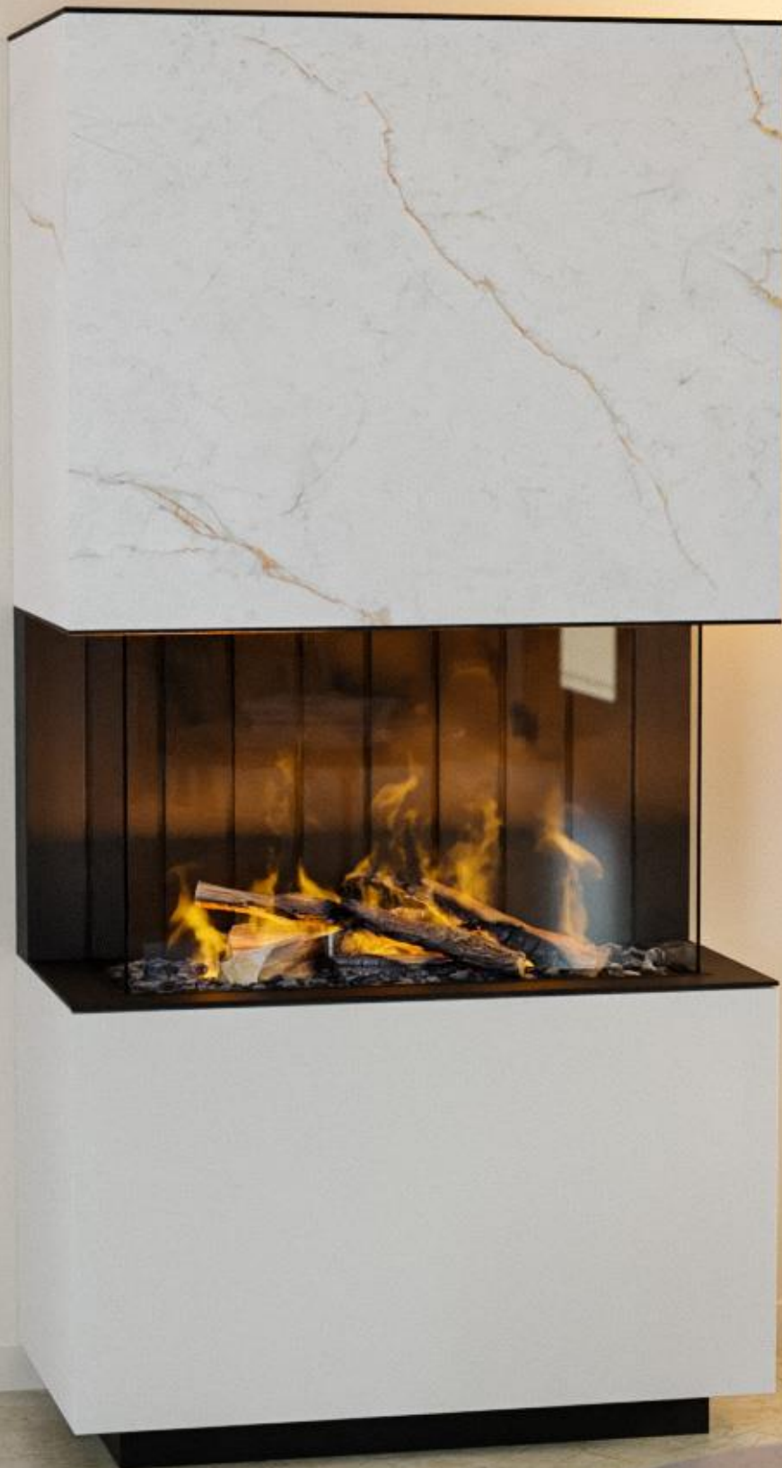
Modell Elyn Gemütliche Strahlungswärme & edle Materialien