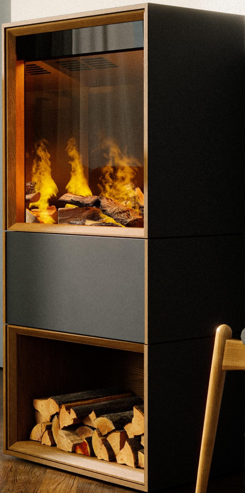
Modell Lio Linoleum & geölte Eiche